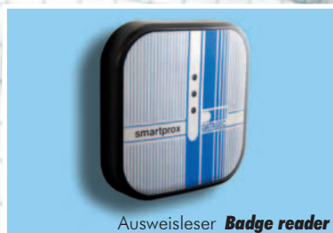
Ausweisleser Badge reader